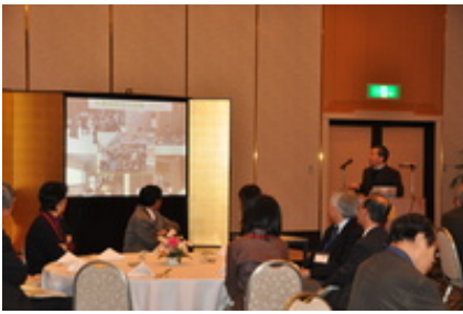
里親の先生とインタビューを！