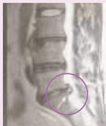
【図1】 腰椎の側面像 矢印が飛び出したヘルニアで腰の神経を圧迫している。

ルニアによって引き起こされた神経の炎症をおさえる薬剤を神経周囲に注入する方法)により、まず保存的に治療を行い、コントロールできない場合には、顕微鏡を使用して極力からだに与える侵襲が少なくなるようにしながら、ヘルニア摘出手術を行っています。