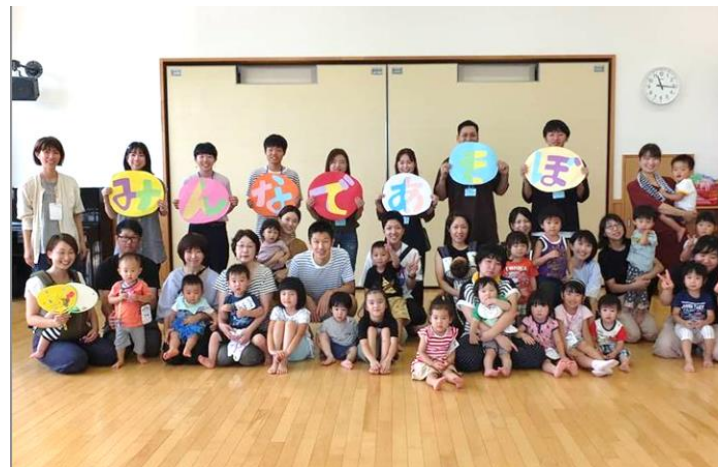
▲みんなであそぼ in浜田コミセン